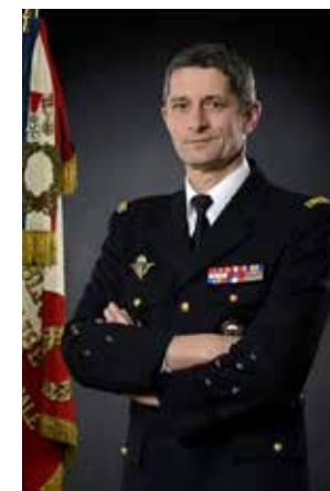
GÉNÉRAL D'ARMÉE DENIS FAVIER DIRECTEUR GÉNÉRAL DE LA GENDARMERIE NATIONALE

La prévention est un outil majeur de la gendarmerie face à cette menace. Elle est ciblée sur les personnes les plus vulnérables et notamment les mineurs. Face à la diversité des menaces, les actions de sensibilisation doivent appréhender l'ensemble du spectre de cette nouvelle délinquance afin d'être efficaces. Créées en 1997, 43 brigades de prévention de la délinquance juvénile (BPDJ) déployées sur l'ensemble du territoire sont chargées de mettre en œuvre des actions de prévention auprès des mineurs au sein des établissements scolaires. Face à l'accroissement de la cyberdélinquance, ces unités effectuent depuis déjà de nombreuses années des séances de sensibilisation aux dangers d'internet. L'engagement de la gendarmerie dans l'opération Permis Internet pour les enfants conforte sa position d'acteur majeur dans la lutte contre la cyberdélinquance, et confirme sa présence sur tout le spectre de la cybermenace.